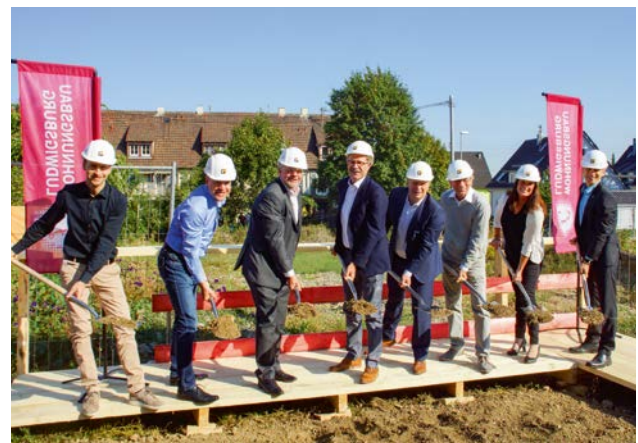
Spatenstich in der Heinrich-Schweitzer-Straße: Hier baut die Wohnungsbau Ludwigsburg 50 Mietwohnungen, davon 23 öffentlich geförderte Wohnungen.