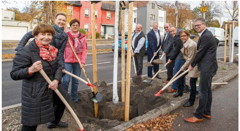
Auftakt zur Nachhaltigkeitsinitiative „100 Bäume in 10 Jahren“: Die WBL pflanzt jährlich zehn Zukunftsbäume in einem anderen Stadtteil, 2018 waren es zehn Kaiserlinden in Eglosheim.