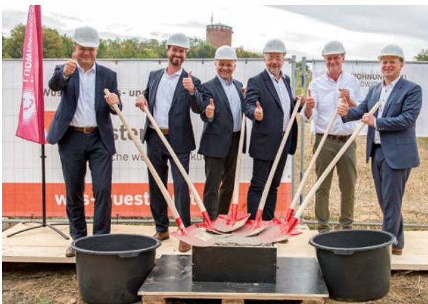
Gemeinsame Grundsteinlegung im Muldenacker: Die WBL und die Wüstenrot Haus- und Städtebau (WHS) erstellen hier drei Gebäude mit öffentlich gefördertem Wohnraum.

Die Vermögenslage der Gesellschaft ist geordnet. Die Geschäftsführung beurteilt die wirtschaftliche Lage des Unternehmens positiv.